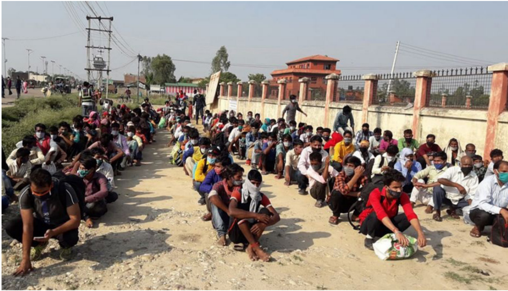
स्वदेश फर्किन पाउने आशा : भारतमा रहेका नेपालीहरु लकडाउनकै बीच देश फर्किन पाउने हल्ला चलेपछि विहिवार नेपालगञ्ज नाकामा सयौं नेपाली आइपुगेका छन् । करिब दुई हजार बढिको भिड आएपछि आरिडटी परीक्षण र अभिलेख राखेर विहिवार पाँच सय जनालाई नेपाल प्रवेश दिइएको छ । नेपालमा रहेका करिब आठ सय भारतीय नागरिकलाई भारत पठाइने ।

मंगलबार यतामात्र राजधानीमा ५ जनामा कोरोना संक्रमण पुष्टि बाँकी पृष्ठ २