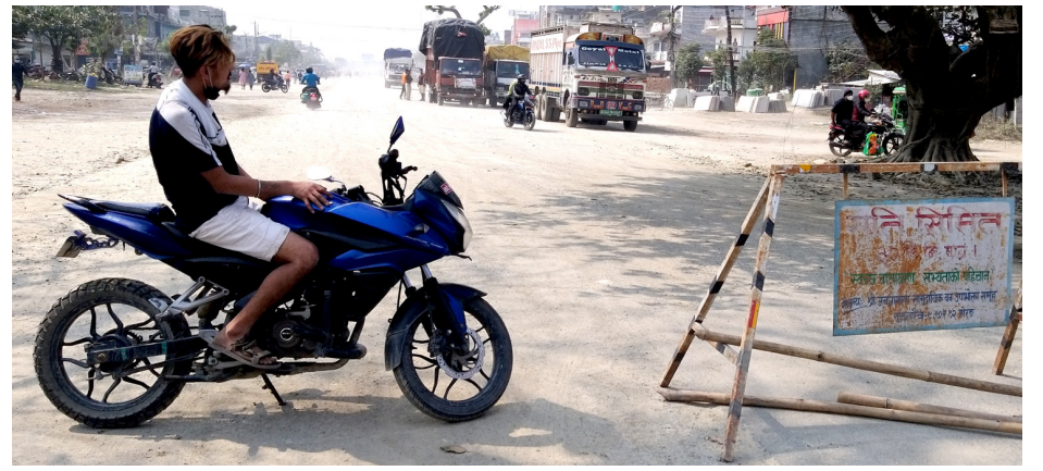
मोरङको सुन्दरहरैचास्थित विराटचोकको महेन्द्र लोकमार्ग धुलाम्यै भएर बस्ने नसकिने भएको र सडक दुर्घटना हुने सम्भावना बढेको भन्दै सडक अवरुद्ध गर्दै स्थानीयवासीहरू। उनीहरूले भत्काएको सडक चाँडै निर्माण गर्नुपर्ने र सडकमा धुलो नियन्त्रणका लागि पानी हालनुपर्ने लगायतका माग राखेका छन्।